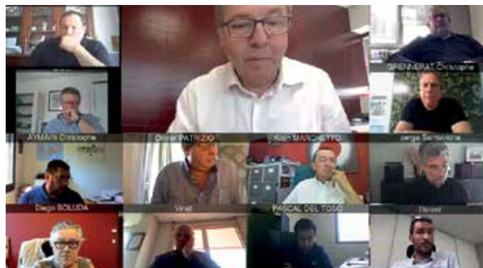
Assemblée Générale de l'UNECP-FFB, 9 juillet 2020 en visioconférence