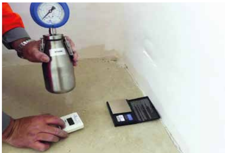
Mesure du taux d'humidité avec la méthode de la bombe à carbure.

Non, en logement collectif, la pose scellée de carreaux sur sous-couche isolante n'est plus visée sur un plancher sur vide sanitaire. Les planchers sur vide sanitaire sont considérés comme des planchers intermédiaires. Le NF DTU 52.1 de février 2020 ne vise plus la pose scellée de revêtement de sol sur souche isolante ou sur couche de désolidarisation en plancher intermédiaire des bâtiments d'habitation collectifs.